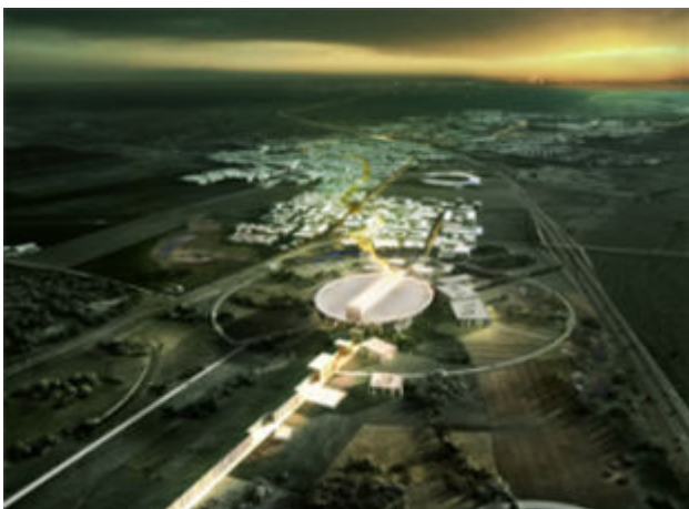
Illustration fra vinderen af arkitektkonkurrencen Team Henning Larsen Architects.

Flere undersøgelser peger på, at der opstår en række meget betydelige indirekte eller afledte effekter i kølvandet på en stor international forskningsfacilitet, og som i mange tilfælde overstiger de direkte effekter, der kan henføres til facilitetens drift og etablering. Det drejer sig typisk om effekter, der opstår i samspillet mellem faciliteten og det regionale erhvervsliv og bl.a. resulterer i etableringen af nye højteknologiske virksomheder, styrket arbejdsmarked for højtuddannede samt bedre mulighed for virksomhedernes F&U-aktiviteter.