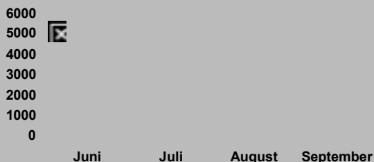
www.euo.dk (gns. besøg)

Statikken for september viser, at private borgere stod for 6 ud af 10 henvendelser, hvilket sender et signal om, at befolkningen ønsker oplysning og neutral information om ikke mindst EU-konventet og regeringskonferencen. Studerende holder sin traditionelle andenplads med 20 % af forespørgslerne. Ny på tredjepladsen er offentlige myndigheder med 4 % af henvendelserne.