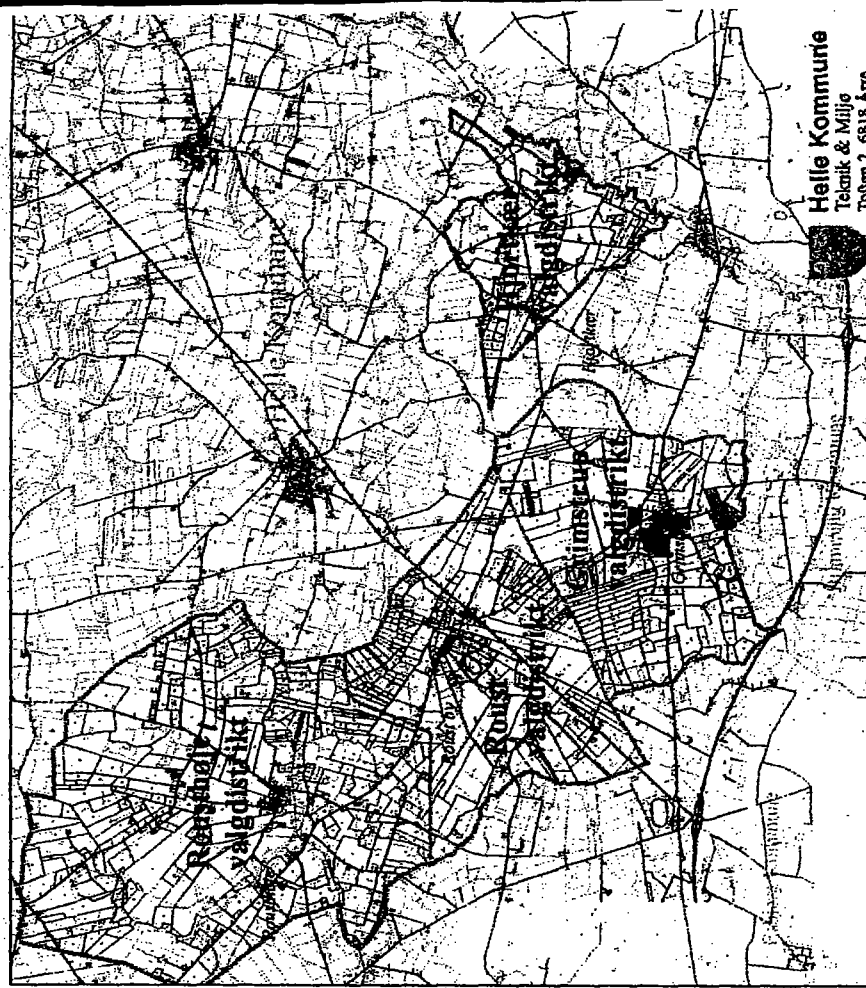
Forberedelsesudvalget i Helle Kommune har samme med Grimstrup-gruppen fastlagt følgende fire afstemningsområder.