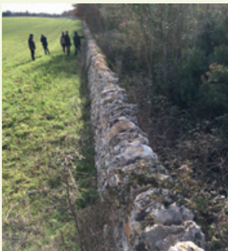
Stenvæg i Puglia (IT)