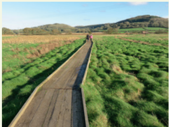
Sti i vådområde i East Devon (Det Forenede Kongerige)