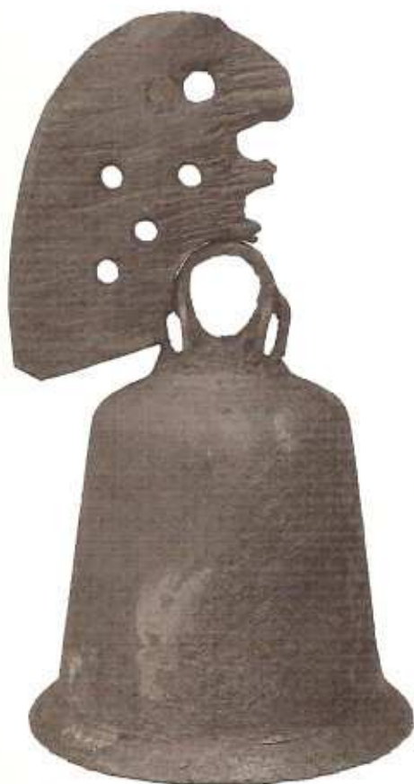
Hedebyklokken, der er Nordens ældste bevarede kirkeklokke. Den er dateret tilbage til omkring år 900.

Det kan lokalt overvejes at genoptage nogle af dem. Om beskrivelse af lokale ringeskikke henvises til afsnittet "Beskrivelse af lokale ringeskikke" side 10.