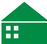
Havebolig 842 kr.

Dansk Affaldsforening har derfor indsamlet erfaringstal fra 8 kommuner der indsamler affald – herunder emballageaffald – helt ude ved husstanden. Tallene viser at indsamling og håndtering af emballage affald fra en havebolig koster 842 kr. årligt, mens det for en boligenhed i en etagebolig koster 335 kr. årligt. Sommerhuse regnes, som tommelfingerregel, til at svare til ca. 25% af en havebolig og det koster altså årligt 241 kr. for disse.