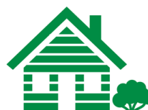
Sommerhus 241 kr.