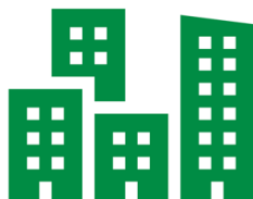
Etagebolig 335 kr.