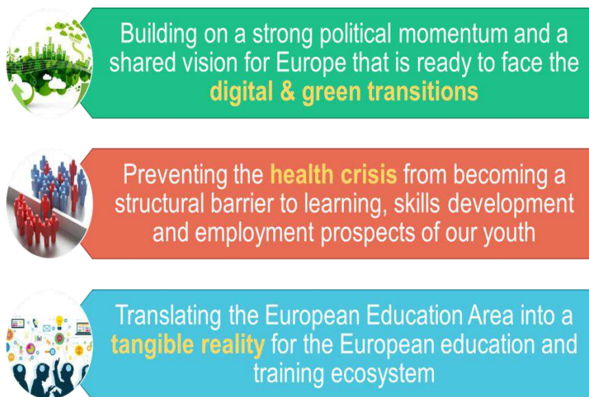
Grafik: Etablering af det europæiske uddannelsesområde.

Vedtagelsen af den nye handlingsplan for digital uddannelse 13 støtter udbredelsen af digitale teknologier, der er nødvendige for uddannelse og erhvervsuddannelse, og at udstyre alle borgere med digitale kompetencer. Kommissionen foreslog i august 2021 en henstilling fra Rådet om blandet læring for at yde bedre støtte til skoler og lærende, der er berørt af den digitale omstilling, pandemien har udløst, bl.a. gennem yderligere læringsmuligheder og målrettet støtte til lærende, der oplever indlæringsvanskeligheder 14 .