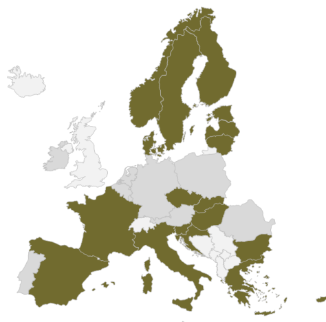
Figur 1: Feedback fra repræsentanter for ASAP-programudvalget